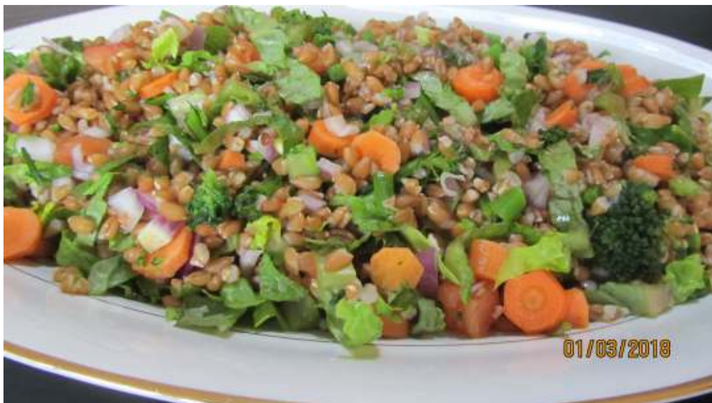
Amanida amb pisana