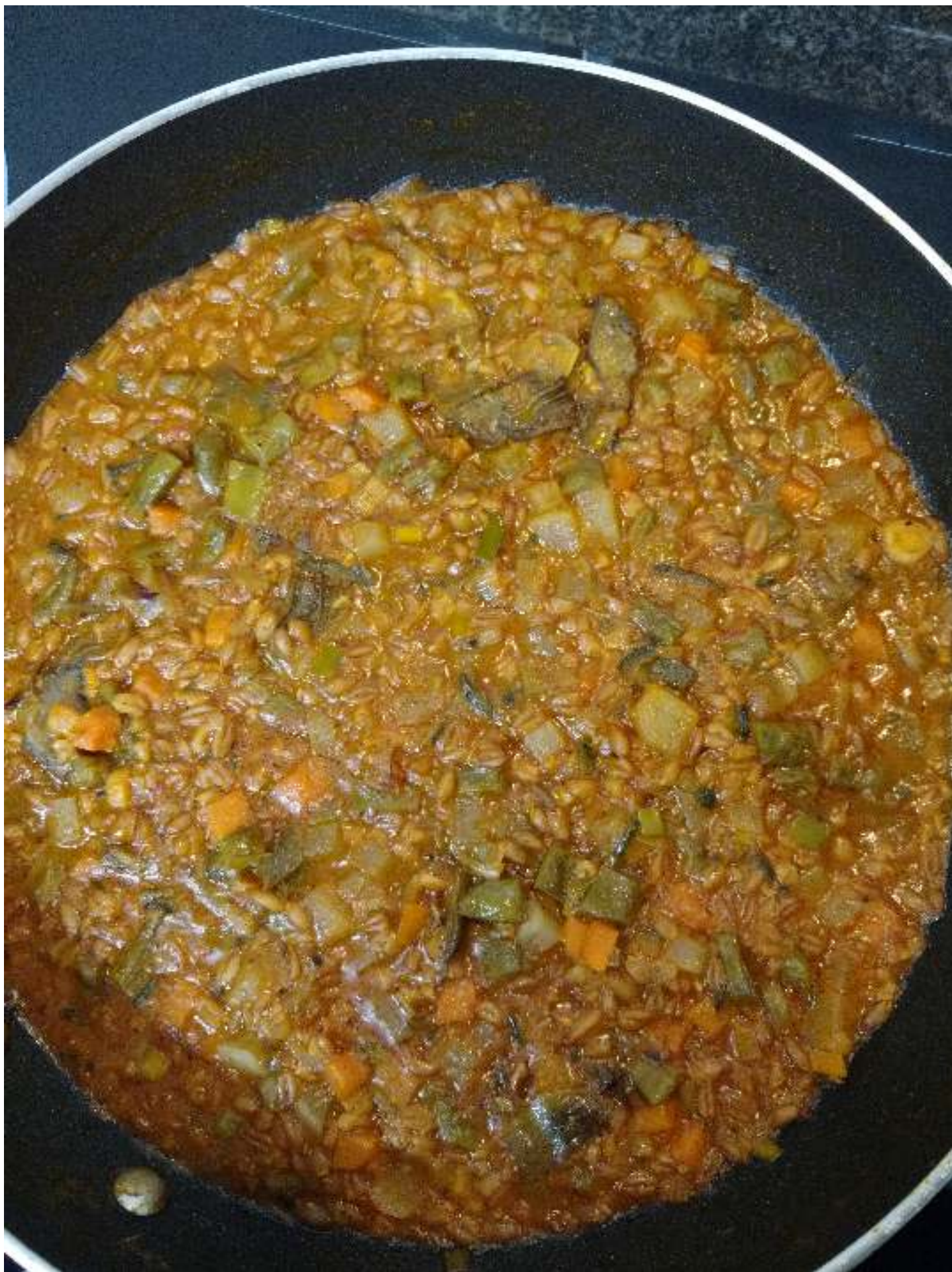
Recepte «farrotto» o risotto de pisana i verdure