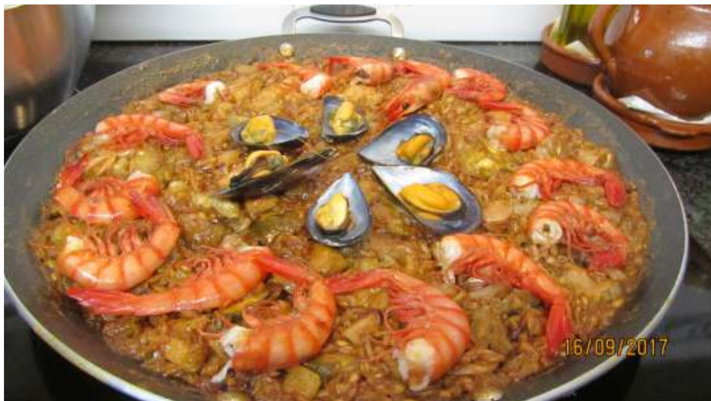
Paella de pisana amb carn i marisc