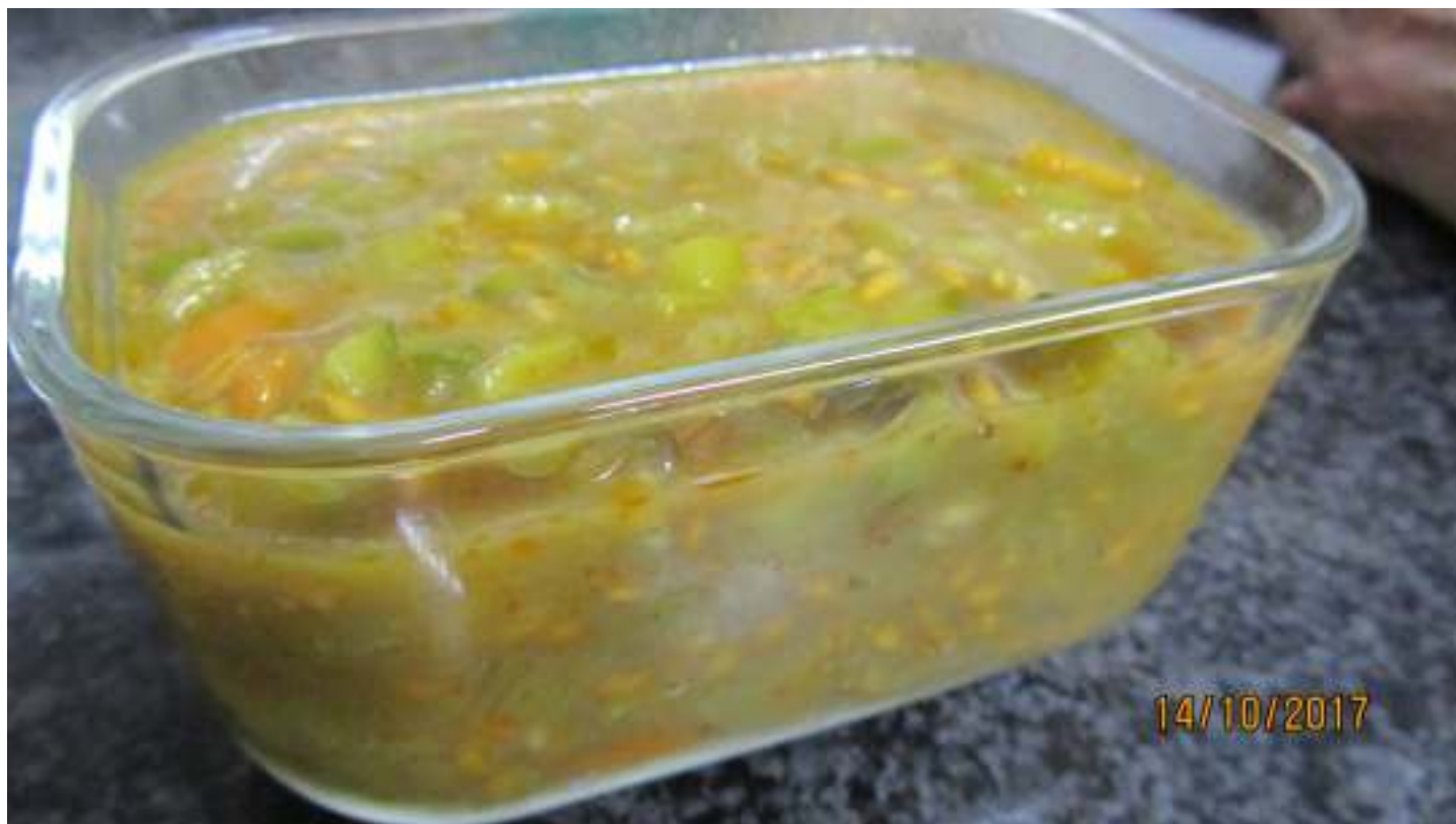
Potatge de pisana