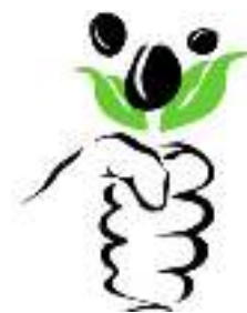
Cátedra de Soberanía Alimentaria de la Universidad Nacional de La Plata

Durant segles el sistema agroalimentari es basava en l'agricultura de subsistència, en els petits agricultors que conformaven el gruix de la població. A partir dels anys 70 la societat va començar a perdre de manera important aquesta relació amb el camp i a dia d'avui depenem excessivament d'aliments produïts a molts quilòmetres de distància de l'indret on són consumits.