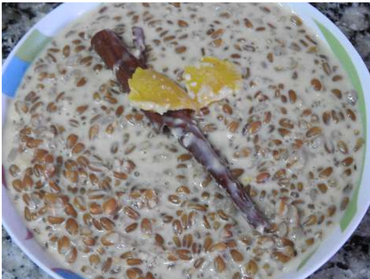
Postre de pisana amb llet