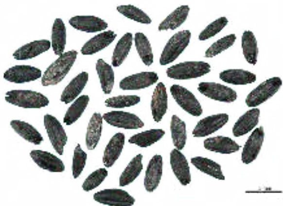
Restes arqueològiques de pisana

l'espelta, el blat, l'ordi, el sègol, la civada, l'arròs... fins al punt que en l'actualitat s'estima que els cereals aporten el 45% de les calories alimentàries de la humanitat (segons la FAO/STAT).