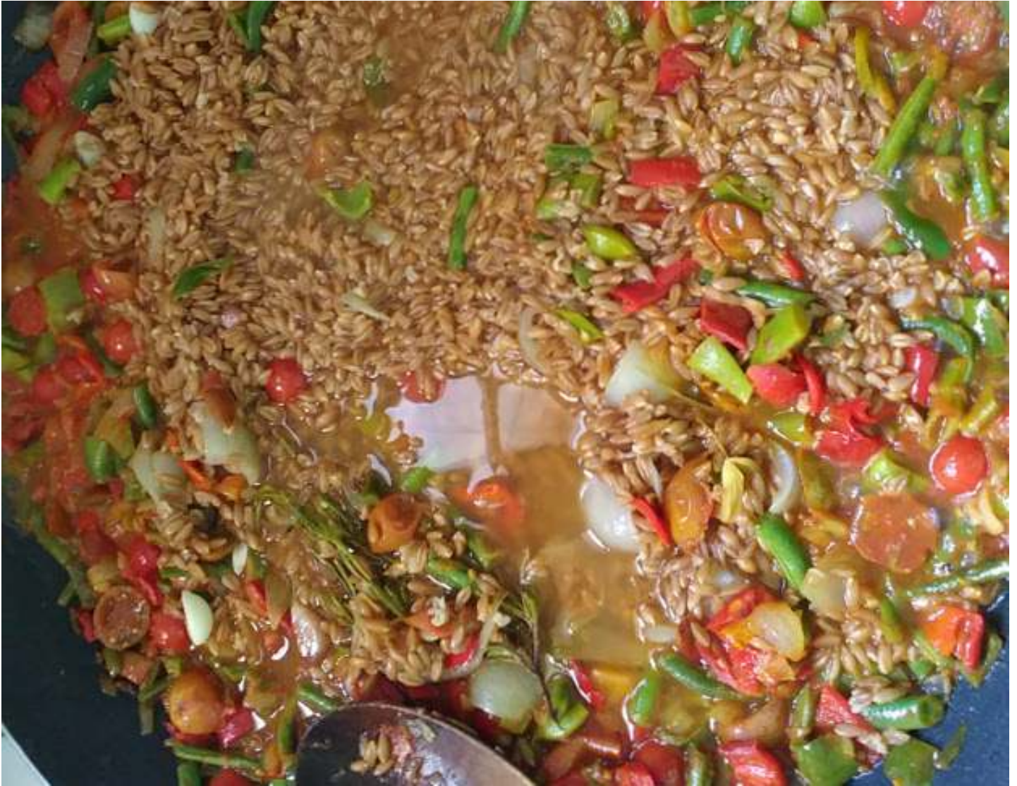
Paella de pisana amb verdures varies