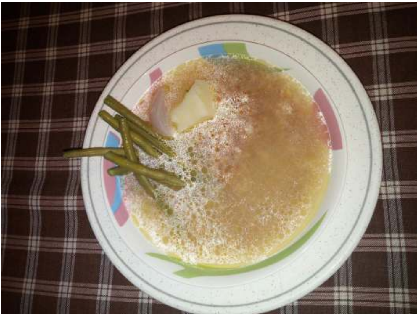
Sopa de pisana