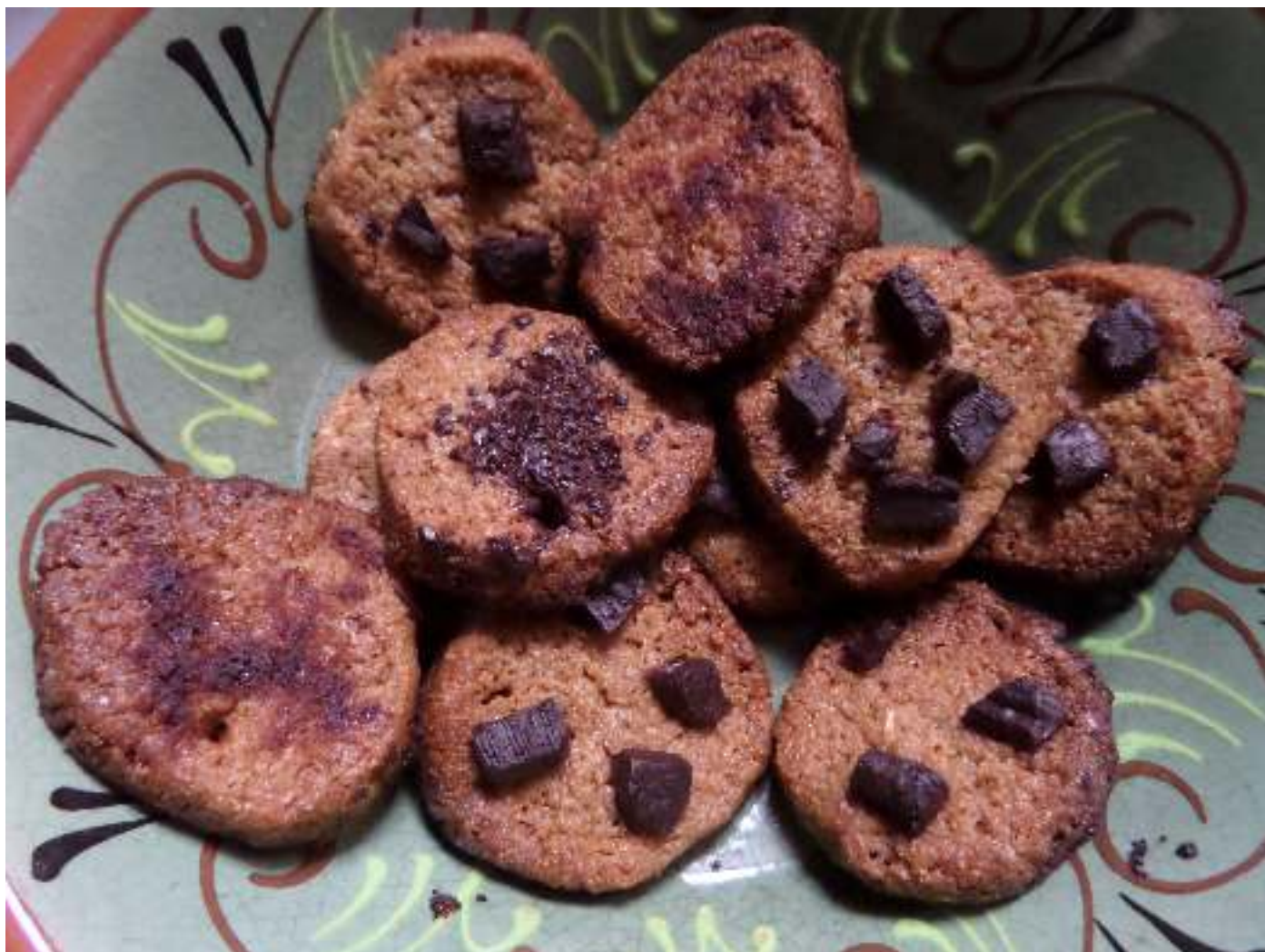
Recepta galetes de mantega