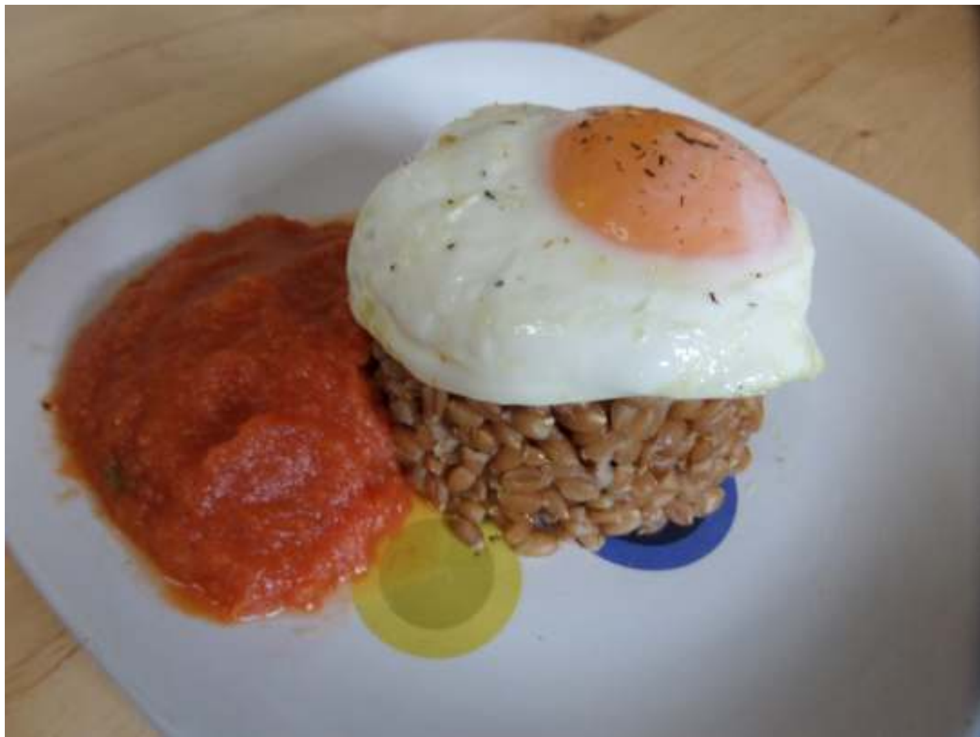
«Pisana» a la cubana