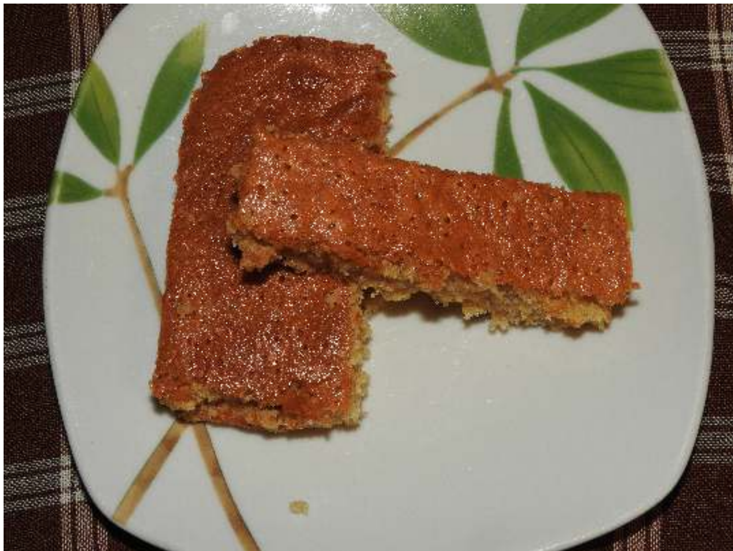
Pa de pessic de pisana