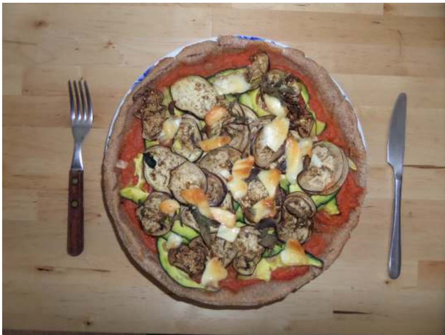
Pizza de pisana