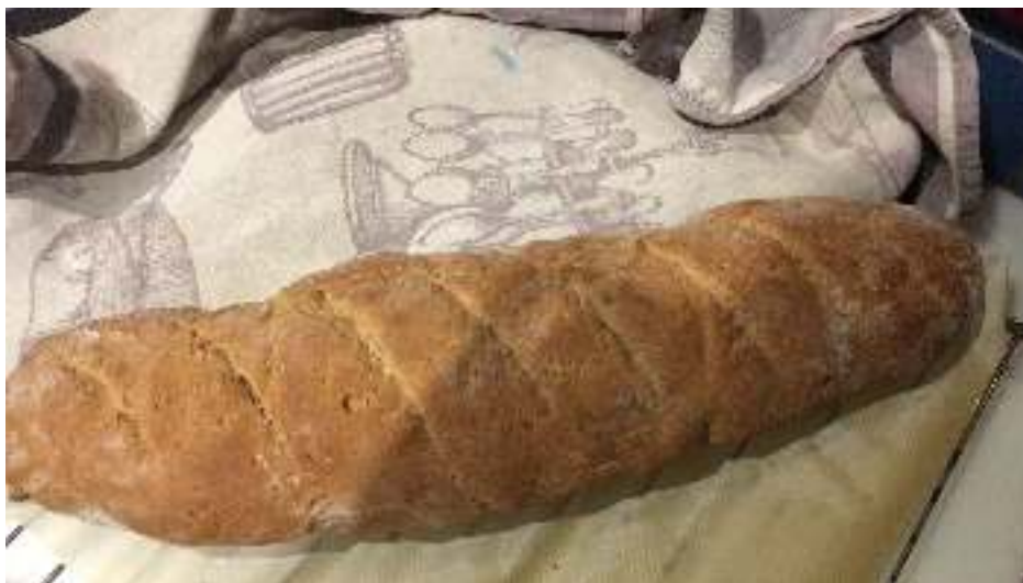
Pa de pisana